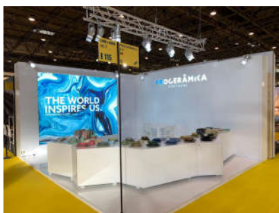
Paris – Set 2019