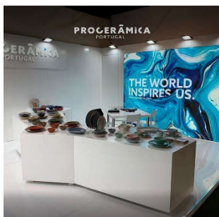
Frankfurt – Fev 2020

Resultados Alcançados: Projeto em curso com algumas atividades já desenvolvidas: