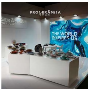
Frankfurt – Fev 2020